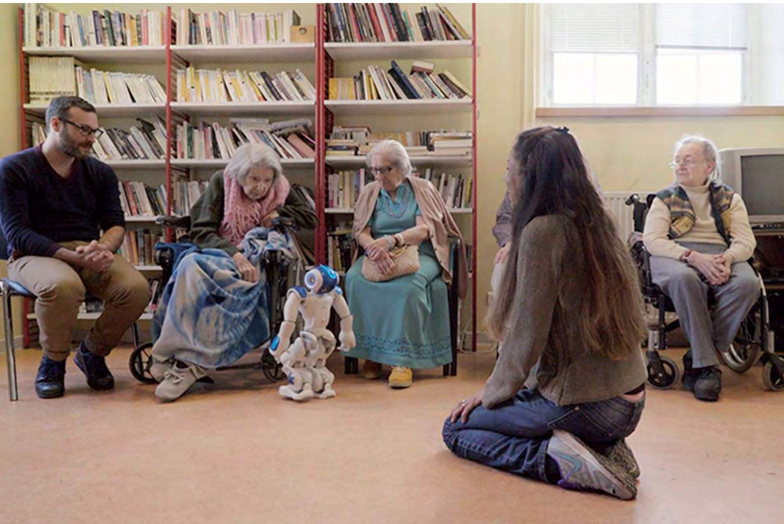
Photo tirée de la vidéo " Lusage " ©Yves Gellie, avec Upian et Malakoff Médéric Humanis

Samedi 18 mai, de 14h à 17h , le Living Lab de l'hôpital Broca vous ouvre ses portes, l'occasion de découvrir les différents projets de recherche, mais également d'y contribuer car le principe d'un Living Lab est de mêler les utilisateurs à tous les moments-clés de la conception d'un projet.